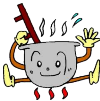
富山市子どもの村イメージキャラクター ごえもんちゃん